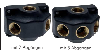
mit 2 Abgängen